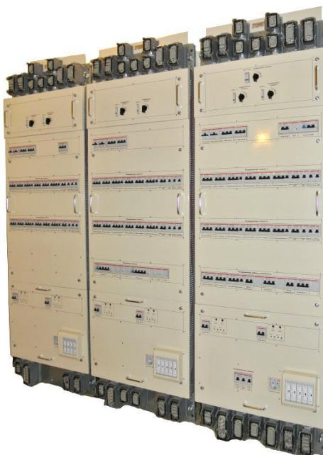
Панели защиты кондиционеров