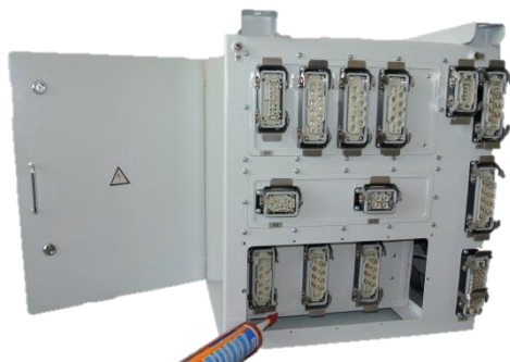
Блок распределительный БР