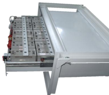
АЯ-760 с установленными АКБ

Предназначен для установки на вагоны метро серии 81-760.