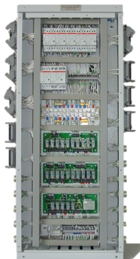
Блок коммутации БК