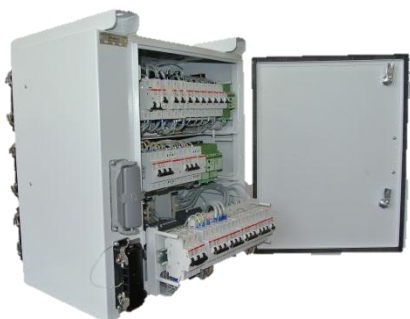
Блок распределительный БР

Подвагонное оборудование из номенклатуры дизель-поезда ДП-С. Модульные технологии примененные в этом проекте использованы в дизель-поездах РА-21, ДП-И, ДП-М.