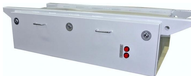
АЯ-760 в закрытом состоянии

WWW.KB-MST.RU г.Ростов-на-Дону, ул.Смычки,66 тел. (863) 211-11-41, факс: (863) 200-38-26