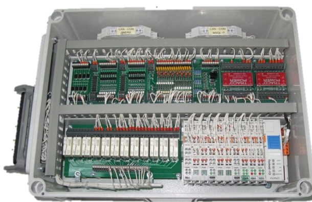
Панель управления вагоном ПУВ