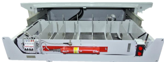
Выдвижная кассета АЯ-760