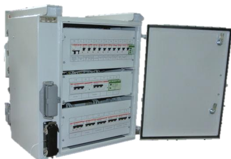
Блок распределительный БР