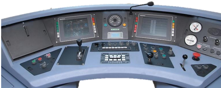
Пульты кабины машиниста и мониторы системы управления и информационного комплекса