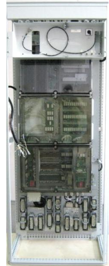
Стойка электро- оборудования