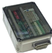
Модуль панели управления вагоном