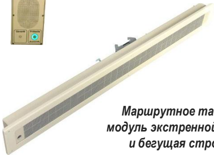
Маршрутное табло, модуль экстренной связи и бегущая строка